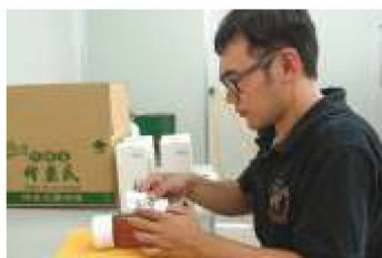
4. 熟練地將裝好蜂蜜的瓶子貼上正確的產品標示。