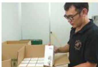
5. 將一罐罐蜂蜜裝入紙箱，準備出貨送給客戶。