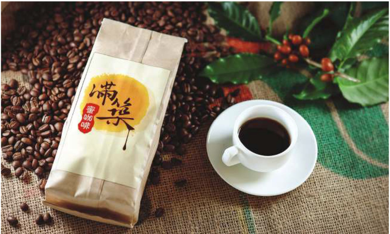
好的咖啡會回甘，蜜咖啡讓你體驗好咖啡的滋味。