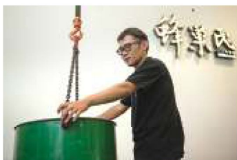
1. 在養蜂場從蜂巢取蜜後，將桶裝蜂蜜運送至工場。

蜂巢式的產品除了龍眼蜂蜜、玉荷包蜂蜜、蜂蜜醋等飲品以外，加工製造的品項也相當多元，包括有蜂蜜牛軋糖、蜂王乳膠囊、蜂膠、破壁花粉等，提高蜂蜜產品的經濟價值；目前除了自行銷售以外，也積極與異業合作，除進駐高雄物產