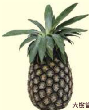
大樹當地名產鳳梨