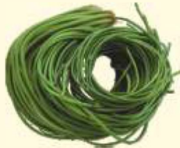
野蓮 美濃中正湖乾淨的水質種植出來的野蓮菜。

取自高雄美濃中正湖裡的野蓮菜，用薑絲、破布籽入菜，吃起來清脆爽口，也是一道相當受歡迎的在地風味。