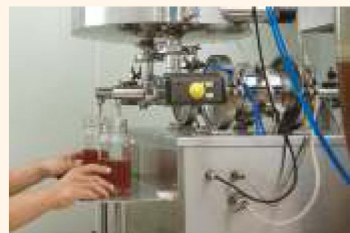
3. 將洗淨的瓶子烘乾後，利用填充機將蜂蜜裝瓶。