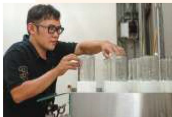
2. 用洗瓶機清洗瓶子，一次可以清洗16支瓶子。