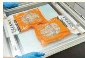
6. 真空包裝商品，並進行最後檢查。