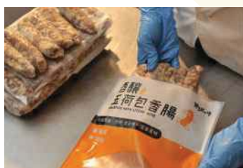
5. 包裝袋裝填香腸，打印保存期限。