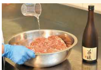
2. 選擇優質塊肉，分切肉塊，調整玉荷包酒釀和肉品比例攪拌入味。