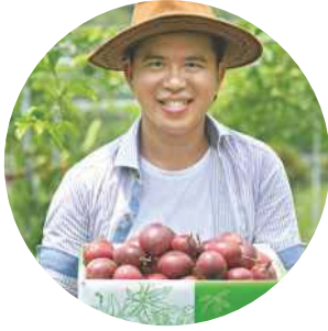
型農 丁群展 · 吉貓農園 ·